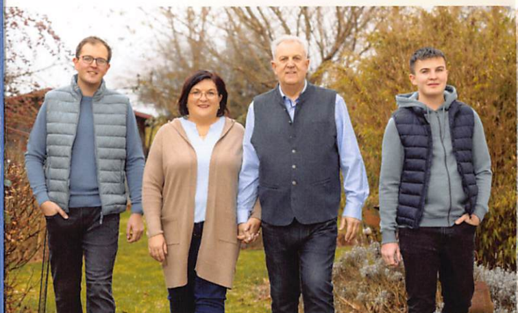
Gemeinderätin seit 2014 3. Bürgermeisterin seit 2020

Die heimische Natur und unser Garten sind für mich wichtiger Ausgleich zum Arbeitsalltag.