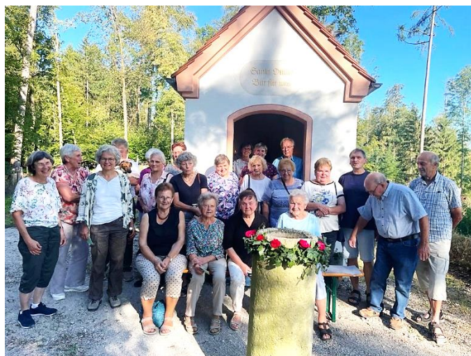
Die SeniorInnen der Pfarrei St. Michael Wengen im August, beim Besuch der Ottilienkapelle in Asbach.

Wir freuen uns auf ihren Besuch. Seniorenteam Wengen/Riedsend