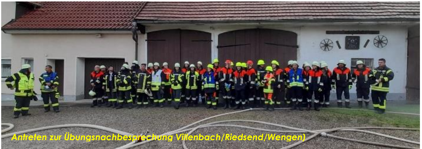
Antreten zur Übungsnachbesprechung Villenbach/Riedsend/Wengen)

Reanimation einer leblosen Person/Übungspuppe