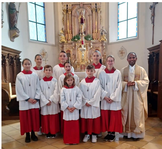
Ministranten Verabschiedung 2023